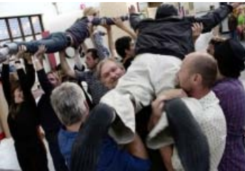
Performance/workshop v. Christian Falsnaes: Beyond the Threshold there is Darkness .