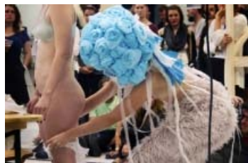
Fotoet viser The Mob: Let's Marry fra 68 Square Metres messestand.