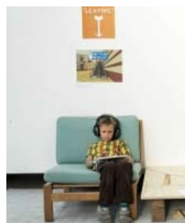
Foto fra Haandholdts messestand.