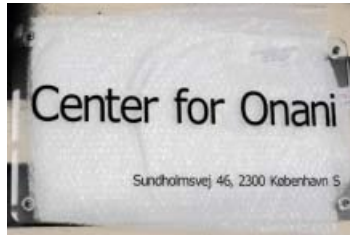
Foto fra Koh-i-noor & Bull Mengers messestand.