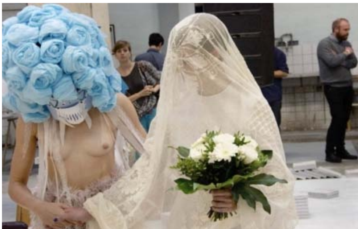
Fotoet viser The Mob: Let's Marry fra 68 Square Metres messestand.

29. sep. 2008 [Billedserie] Fabrikken på Amager åbnede for 3. år i træk dørene for arrangementet Alt_Cph. Læs mere