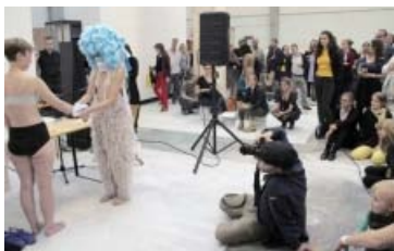
Fotoet viser The Mob: Let's Marry fra 68 Square Metres messestand.