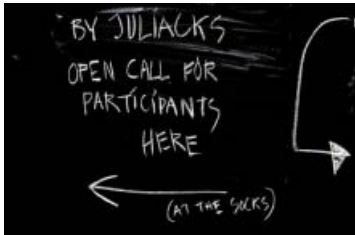
Juliacks rekrutterede deltagere til filmen Amager and the Infinite Whistle .