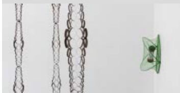
Kunst på afstand