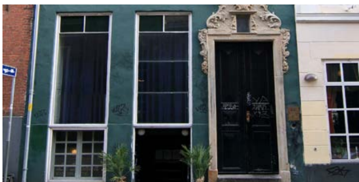
SixtyEights nye facade i Valkendorfsvej. Pressefoto