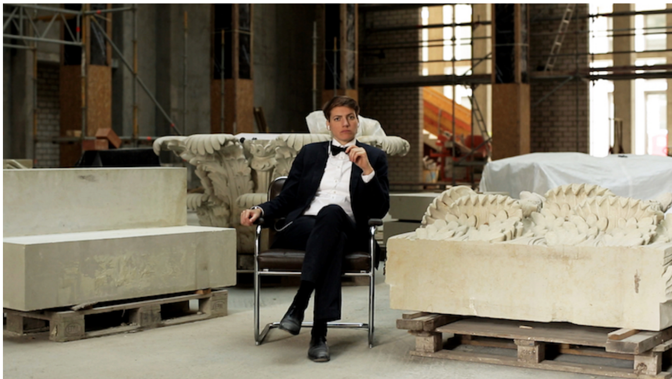
Kerstin Honeit: my castle your castle, 2017, still. Installation, mixed media, HD video, color, sound, 15 min.

Anmeldelse 15 dec 2017 Af Christian Meisels Asmussen