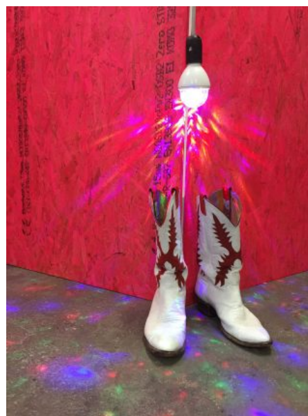
Kerstin Honeit: my castle your castle , 2017. Installation, mixed media, HD video, color, sound, 15 min.

Værket forholder sig polemisk til statens forhold til det historisk bevaringsværdige, og iblander queeræstetiske