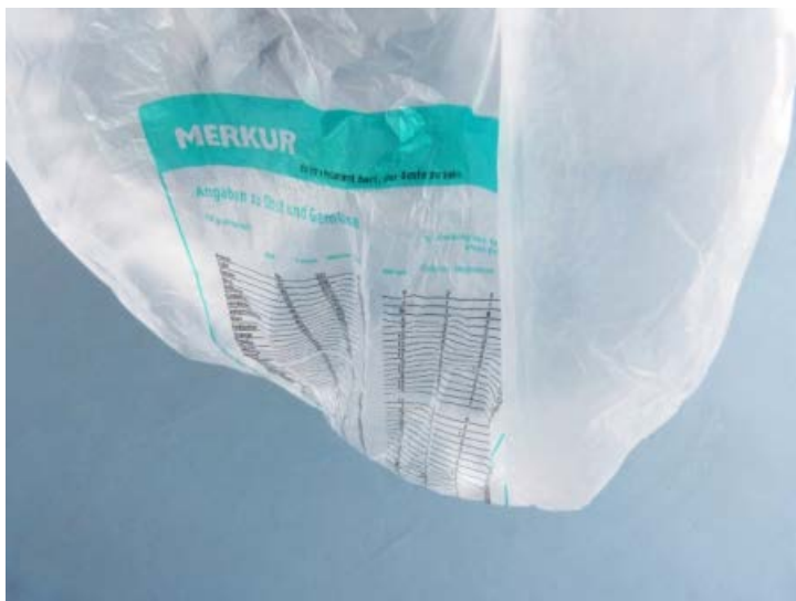
Saskia Te Nicklin: Untitled . Detajle. Plastik bærepose. På gruppeudstilling m. Stefania Batoeva, Esmerelda V. Lindström, Saskia Te Nicklin, 68 Square Metres.

12/9 - 20/12 14 uger 4/1 - 1/5 17 uger 12/9 - 1/5 31 uger