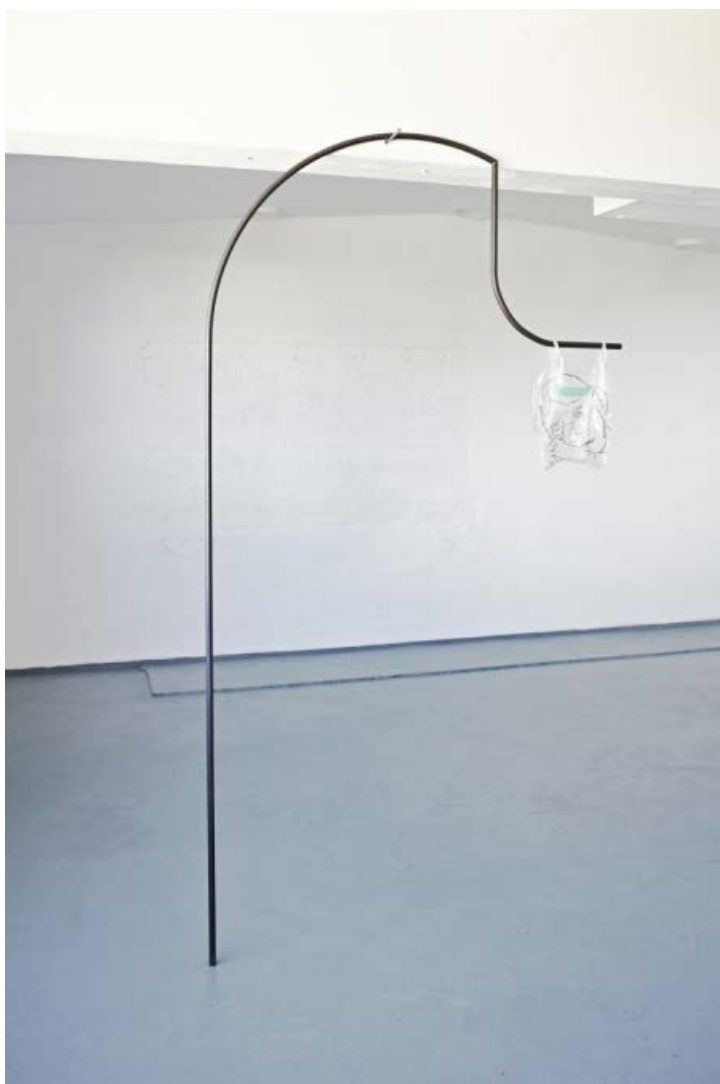
Saskia Te Nicklin: Untitled . Sort vokset jern, plastik bærepose. På gruppeudstilling m. Stefania Batoeva, Esmerelda V. Lindström, Saskia Te Nicklin, 68 Square Metres.

virkeligheden I værkstedet Statens Kunstfond U-TURN Alt_Cph 2008 Udstillingsrum for eksperimenter Politisk kunst Østeuropæisk kunst Machine-RAUM Street Art / Graffiti