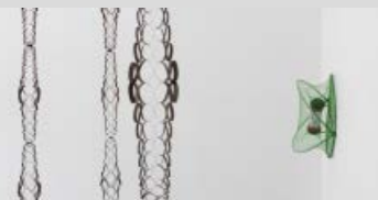
Kunst på afstand