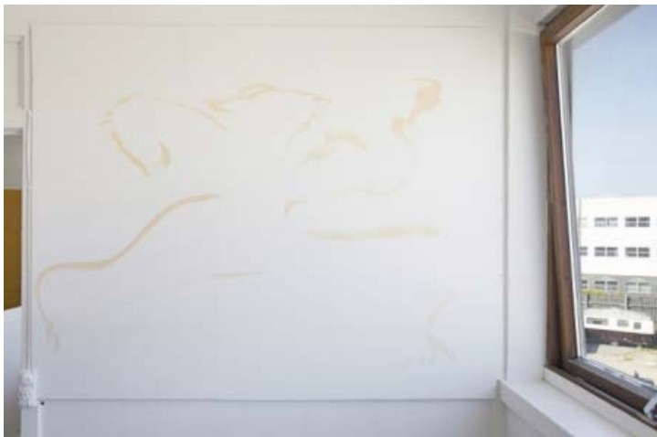
Stefania Batoeva: 5 am Victory . Akryl på væg. På gruppeudstilling m. Stefania Batoeva, Esmerelda V. Lindström, Saskia Te Nicklin, 68 Square Metres.