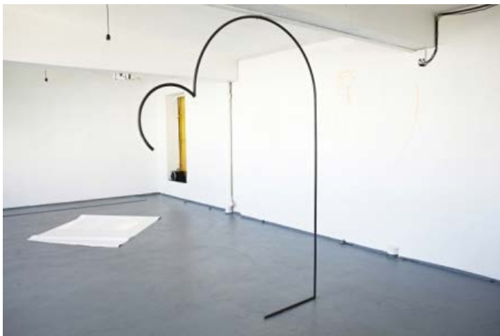
Udstillingsview fra gruppeudstilling m. Stefania Batoeva, Esmerelda V. Lindström, Saskia Te Nicklin, 68 Square Metres.